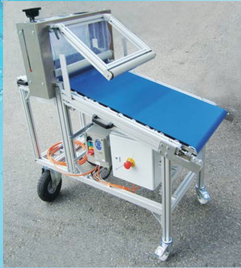
...mit steilem Walzenband...