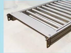
...erweiterbar mit Rollenbahn...