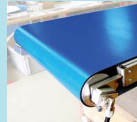
...oder synchron laufendem Transportband.